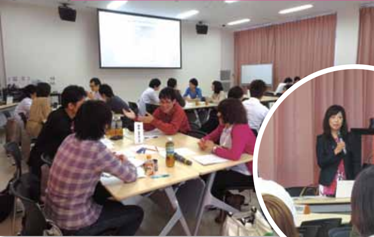
若手医師のキャリア形成支援セミナー