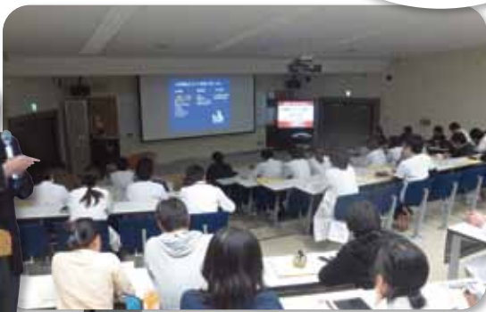
研修医の 明日に役立つ 実践セミナー part2