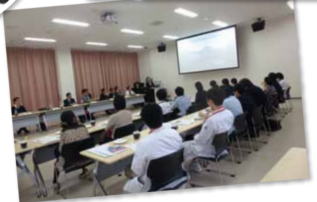
「地域医療研修」等の研修機関からの説明会