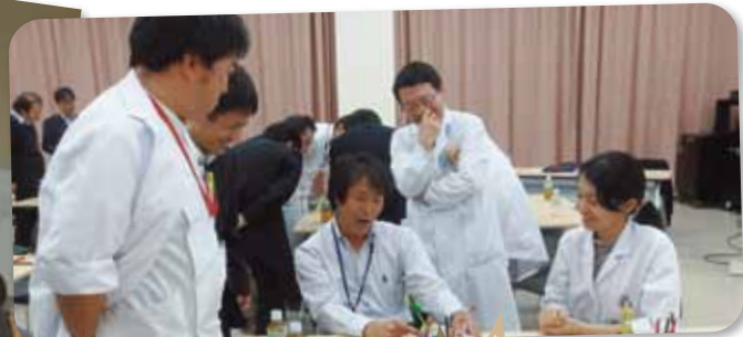
指導医講習会アドバンスコース